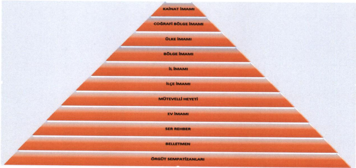
(Örgüt Yapılanması Piramidi)

Fetullah Gülen liderliğindeki örgütün bilinen yasa dışı örgütlerden çok daha sıkı bir hiyerarşik yapılanması bulunmaktadır. Fethullah Gülen'e doğrudan bağlı; "Tayin Heyeti, İstişare Kurulu, Mollalar Grubu ve Meclis" olarak adlandırılan birimler yer almakta ve örgüt üst organlar olarak bu birimler tarafından sevk ve idare edilmektedir. Mecliste alınan kararlar, meclis üyesi olan örgüt mensuplarınca silsile yolu ile en alt birimlere kadar iletilmektedir. Bu talimatlar hiyerarşi içerisinde yer alan "Coğrafi Bölge İmamı, Ülke İmamı, Bölge İmamı, İl İmamı, İlçe İmamı, Ev İmamı, Ser Rehberler, Belletmenler, Öğrenci ve Cemaat Mensupları tarafından gizliliğe, istihbarata ve sır saklamaya özen gösterilerek koşulsuzca yerine getirilmektedir. Ayrıca örgütün mali kaynaklarının ne şekilde kullanılacağını "Mütevelli Heyeti" belirlemektedir.